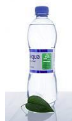
Coca-Cola Sverige 2010